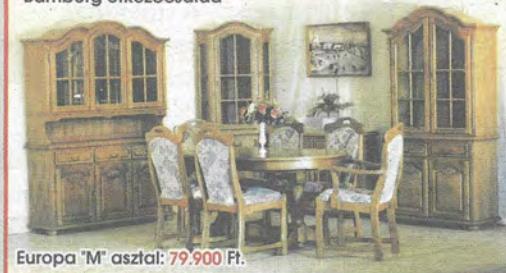
Europa "M" asztal: 79.900 Ft.

Áruházunk: Bp. XVI. Kövirózsa u. 6. www.europabutor.hu Tel./fax: 403-44-69