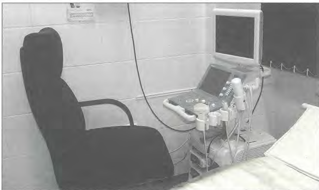
A Fidesz frakció döntésének köszönhetően nagyobb hatékonysággal diagnosztizálhatják a betegségeket