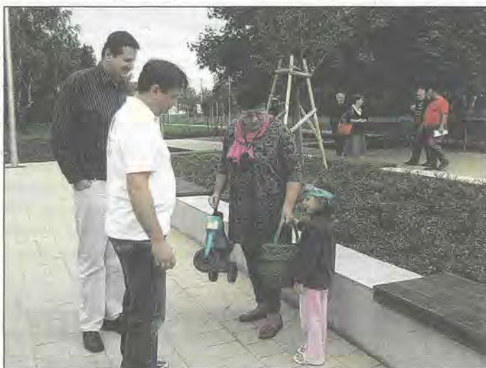
Miután minden elkészült, egy komolyabb átadó ünnepség is lesz

négyzetméternyi területet füvesítettünk be. – Kilencszáz cserjét, 56 fát ültettünk. Új közvilágítás került a parkba és számos közösségi tér. Két játszótér, egy gördeszkapálya, egy szabványm-