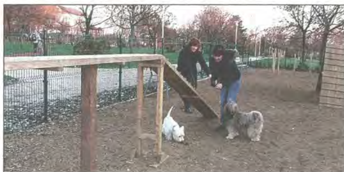
Az önkormányzat mérlegelni fogja az ebtartók javaslatait

- A javaslatunk, hogy legyenek a kutyafuttatók körbekerítve, kitáblázva, a házirend legyen kifüggesztve, ürülékgyűjtő edénnyel és esetleg vízvívási lehetőséggel legyenek ellátva, illetve ha olyan helyen van a futtató, akkor az árnyékolása is legyen megoldva. Ezenkívül szeretnénk, ha minden kerületrészen lenne egy-egy futtató, mert a mostani helyzetben például a cinkotai és árpádföldi kutyatulajdonosok a nagy távolság miatt ki vannak zárva a létesítmények használatából. Mivel tisztában vagyunk azzal, hogy nem lehet egyik