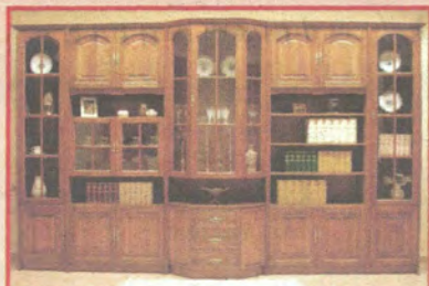
Hargita elemes szekréynyor. 5 színben