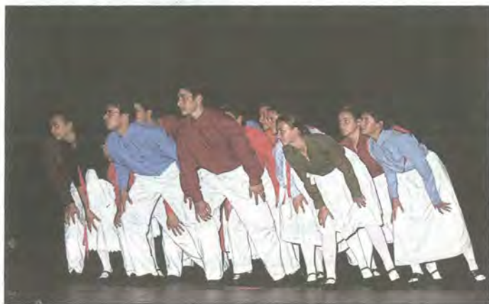
Nem csupán szórakoztatnak, közösségmegtartó küldetést is betöltenek