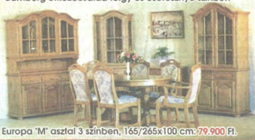
Europa "M" asztal 3 színben, 165/265x100 cm: 79.900 Ft.

Bamberg étkezőcsalád tölgy és cseresznye színben