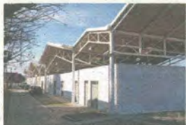
Az új épület egy része