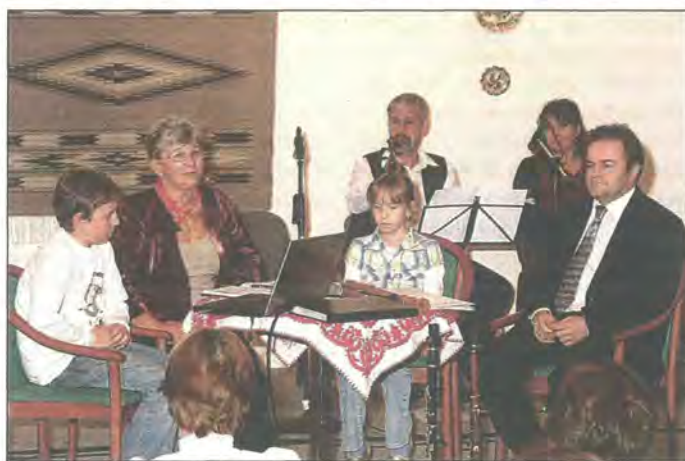
A Vikol-vér többdediziglen zenével van átitatva

vő énektanár elmondta, hogy otthona ugyan örökre Erdély marad, de jó ideje itthon érzi magát a kerületben is.