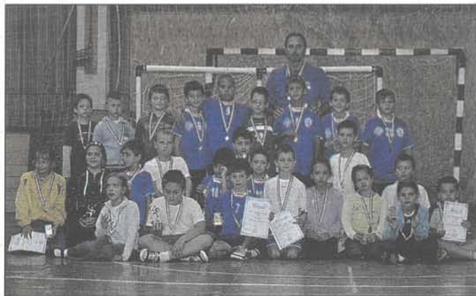
A kerületi kézisek taroltak az INS Kupán is

– Minden kézilabdázni vágyó 1996 és 2004-es születésű leányt, továbbá 2000 és 2004-es születésű fiút szívesen látunk utánpótlásbázisunkon. Az érdeklődőket hétfőn és pénteken 16 és 18 óra között várjuk a Centenárium Általános Iskola tornatermében, illetve a 06-30/301-2401-es számon is szívesen válaszolunk a kérdésekre.