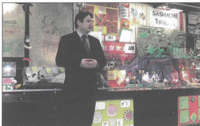
A polgármester szerint az egyik legsikeresebb tábor volt a tavalyi

A január 17-i kiállítás a vitrinekben kiállított képek, újságcikkek és a gyerekek által készített rajzok, kézműves munkák segítségével ennek a 12 hétnek a legszebb pillanatait eleveníti fel.