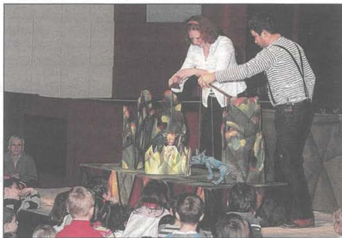
Marionettjáték: kismalac, ne higgy a farkasnak!