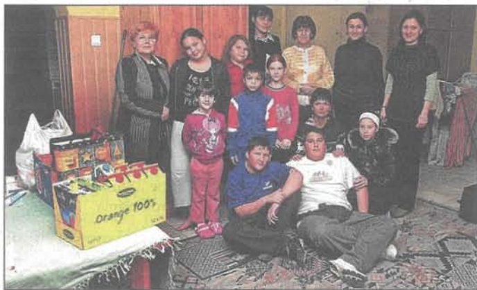
A Farkasbab utcai otthon lakói és a nevelők