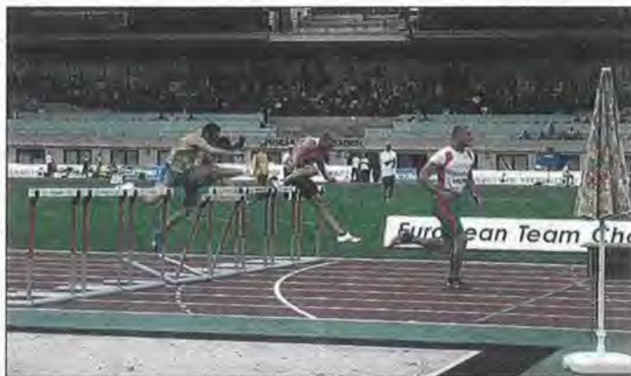
Továbbra is cél a londoni olimpia és a jó szereplés a világbajnokságon

Egy akut problémáról van szó – mesélte a tavalyi barcelonai Európa-bajnokságon bronzérmes gátfutó. – A talpammal ugyanis már régóta szenvedtem, így a műtétet sem lehetett tovább halogatni. A beavatkozásra a János-kórházban került sor, ahol egy talp- és lábspecialista végezte a műtétet. Egyelőre még csak lábado-