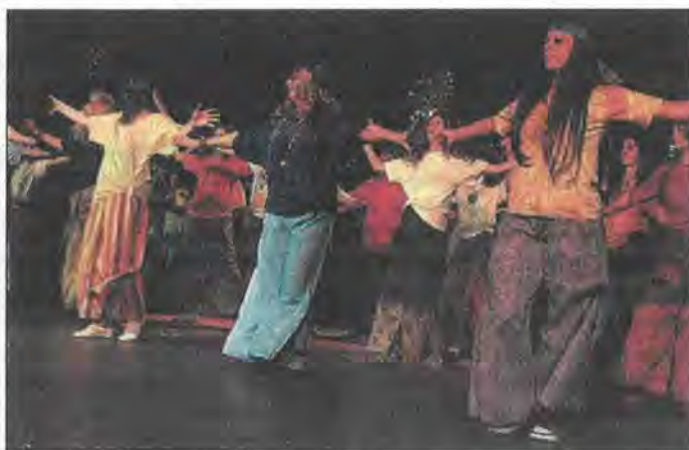
Farsangi virágyerekek: a tanárok tánca

A Kölcsey farsangi karneváljai nem csak jelmezes események. A szentmihályi intézményben e program számít iskolanapnak, mikor minden osztály bemutathatja az erre az alkalomra betanult produkcióját. Ilyenkor megszokott, hogy a Corvin Művelődési Ház nagytermét zsúfolásig megtöltik a nézők. Az idén azonban minden eddiginél többen voltak kíváncsiak a rendezvényre (ez annak is köszönhető, hogy a Hősök terei iskola már három elsős osztállyal kezdte a 2010-2011-es tanévet). Ez azért is nagy szó, mert ezek a farsangi karneválok monstre – hatórás – rendezvények, a nézők pedig szó nélkül végigülik és végigtapsolják a műsort.