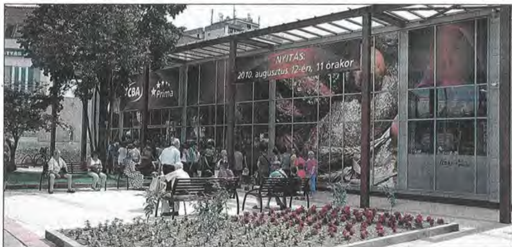
A Jókai utcai felújított közérthez hasonlóan magas színvonalú üzlet jön létre

A szóbeli megállapodás szerint a RÁFÉSZ COOP Zrt. május 2-ig