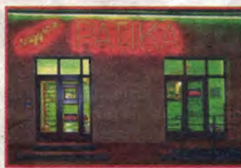
A Nagyicce Patika

Idén januárban új patika nyílt a Veres Péter út 11. szám alatt. A Nagyicce Patika március 21-től kezdve vállalta, hogy egyedül a XVI. kerületben folyamatos ügyeletet biztosít a rendes nyitva tartási idején túl. A Nagyicce Patika a Veres Péter úton gyorsan és könnyen megközelíthető és a kerület lakosai mostantól hamarabb, és rövidebb úton juthatnak a szükséges gyógyszerekhez, a vevőket kényelmes parkolók várják. Az éjszakai orvosi ügyeletből érkező és sürgős receptet kiváltó betegeknek nem kell ügyeleti díjat fizetniük. Az új gyógyszer-tár 170 négyzetméteren széles választékban tartja a forgalmazott gyógyszereket. A magisztrális (helyszínen készített) készítmények mellett szívesen beszerez bármely Magyarországon regisztrált gyógyszert, vagy egyéb gyógyhatású készítményt. A Nagyicce Patika nyitási akcióként jelentős árkedvezményrel kínálja vevőinek a Novorozal hypo-allergén gyógyszerpompát. A Nagyicce Patikában egészségkártyát elfogadnak és bankkártyával is lehet fizetni. A gyógyszer-tár állapotfelmérő gépének használata a vevők számára ingyenes.