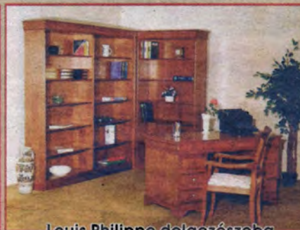
Louis Philippe dolgozószoba