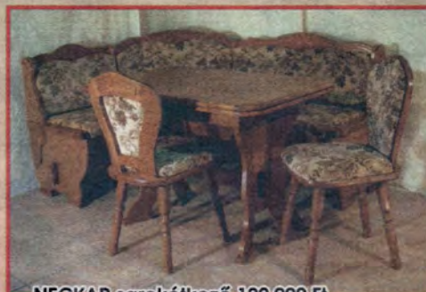
NECKAR sarokétkező 129.900 Ft