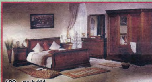
600 - as háló