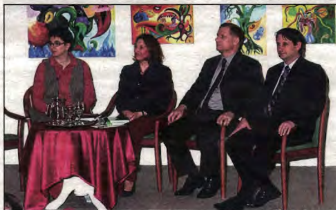
Könyvbemutató és tréning polgármesteri jelenléttel