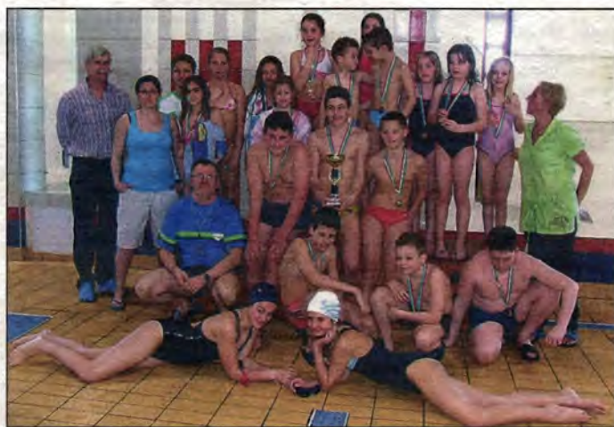
A Szent-Györgyi iskola győztes csapata

Az oka rendkívül prózai: a kerületi gyerekek most jutottak arra a szintre, hogy már versenyt rendezhetnek a számukra. Ez ihlette meg a kerületi önkormányzat sportszakembereit, akik az első iskolai váltó úszókupát meghirdették. A verseny lényege, hogy a jelentkező iskolák korcsoportonként és nemként hatfős csapatokat neveztek, mely csapatoknak hatszor kellett teljesíteniük a 25 méteres távot. Mivel a versenyre a szülők is elkísérték a gyerekeket, akik szurkolóként rendkívül jó hangu-