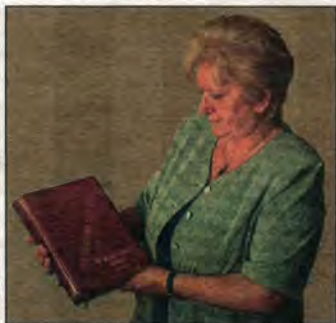
A papa nótáskönyvével

A helyszín Írország, egy hazánkban is működő multicég szakmai találkozójának utolsó napja egy színvonalas ír kocsmában. Remek a hangulat, a szakmai tréningek már lezajlottak, már csak a búcsúparti van hátra. Az est moderátora megkéri a cég csaknem hetven országából összegyűlt alkalmazottait, minden nemzet alakítson négy-öt tagú csoportot, és adjanak elő néhányat népdalaik közül, esetleg tánccal kísérve. Bolgárok, lengyelek, finnek, oroszok, görögök és a többiek mind vidáman és büszkén, tán-