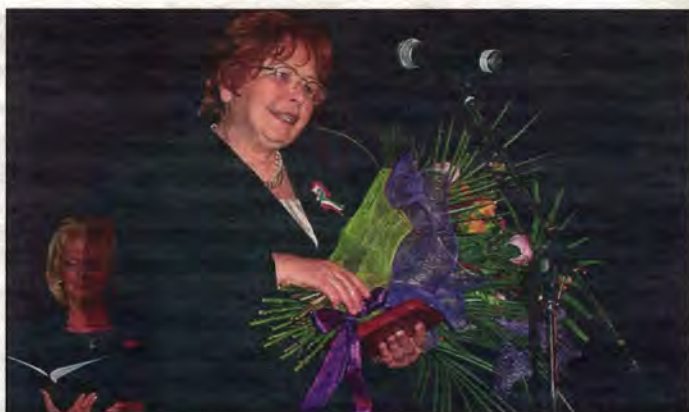
Az elismerés a vitrinben édesapja 1956-os kitüntetésének párja lesz

Édesapját, akit a BKV akkori eldjének megbecsült dolgozója-