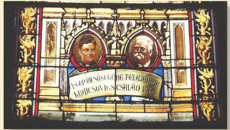
A bombázás után megmaradt két ablak közül az egyik alsó része

Mai rovatunkban folytatjuk Medgyessy Gyula rákosszentmihályi katolikus plébános Budapest ostroma alatt írt, az ellenséges csapatok hadmozdulatairól, a háborús idők helyi hitéletéről szóló jelentését.