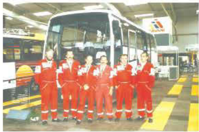
A kiállítások fontos részét képezték az értékesítési munkának