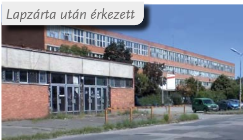
Lapzárta után érkezett

ÚJ TULAJDONOSA VAN AZ IKARUS IPARI PARKNAK. Mivel az eddigi gazdája sem az állammal, sem a kerülettel szemben fennálló kötelezettségeinek nem tett eleget, az Önkormányzat kezdeményezte a cég felszámolását és a végrehajtás megindítását. Hosszú, eredménytelen hirdetés után most egy kínai háttérrel rendelkező magyar cég jelezte vásárlási szándékát azzal a céllal, hogy fő tevékenységként elektromos autók összeszerelését végezné az egykori autóbuszgyár területén. Jelenleg a jogi eljárás folyik, a számítások szerint összesen vehetné birtokba az ipari parkot az új tulajdonos. Ha majd a részleteket is megismerhetjük, hírt adunk róla.