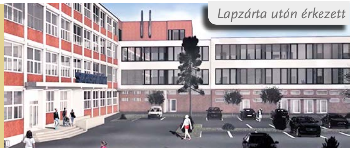
Lapzárta után érkezett

MEGÉRKEZETT A JÓKAI UTCAI SZAKRENDELŐ BŐVÍTÉSÉNEK ÉPÍTÉSI ENGEDÉLYE. A kiviteli terveket a tervező már elkészítette, amelynek most folyik a felülvizsgálata. Ha ez befejeződik, és aláírt szerződés is lesz a tervek mellett, megkezdődhet a közbeszerzési eljárás. Ha lesz érvényes ajánlattevő, és olyan áron dolgozik, amit az Önkormányzat meg tud fizetni, még idén elindulhat az építkezés. Ha mégsem jelentkezne megfelelő kivitelező, a bővítés kezdete átcúsúzhat a következő év tavaszára.