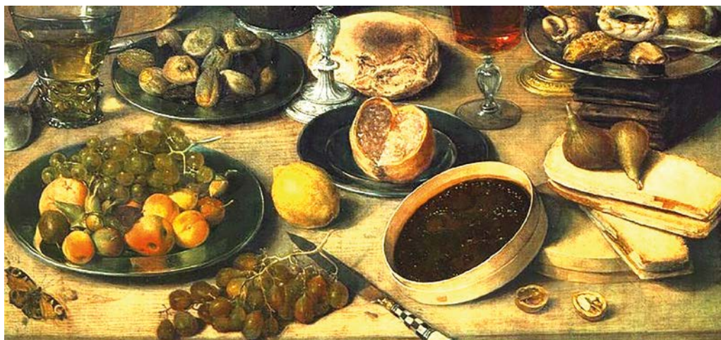
Georg Flegel: Csendélet papagájjal (1630-as évek), részlet

A bissalmát hámozd meg igen apró szeletekre, azután négy font bissalmához tégy egy font nádmézet, s tölts egy icce mustot reá, mennél édesebbet, ha penig igen kemény lenne a bissalma, tölts több mustot reá, hogy forrjon egy kevéssé, s azután töltsd belé a nádmézet, és midőn