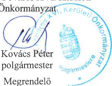
Kovács Péter polgármester

Budapest Főváros XVI. Kerületi Önkormányzat