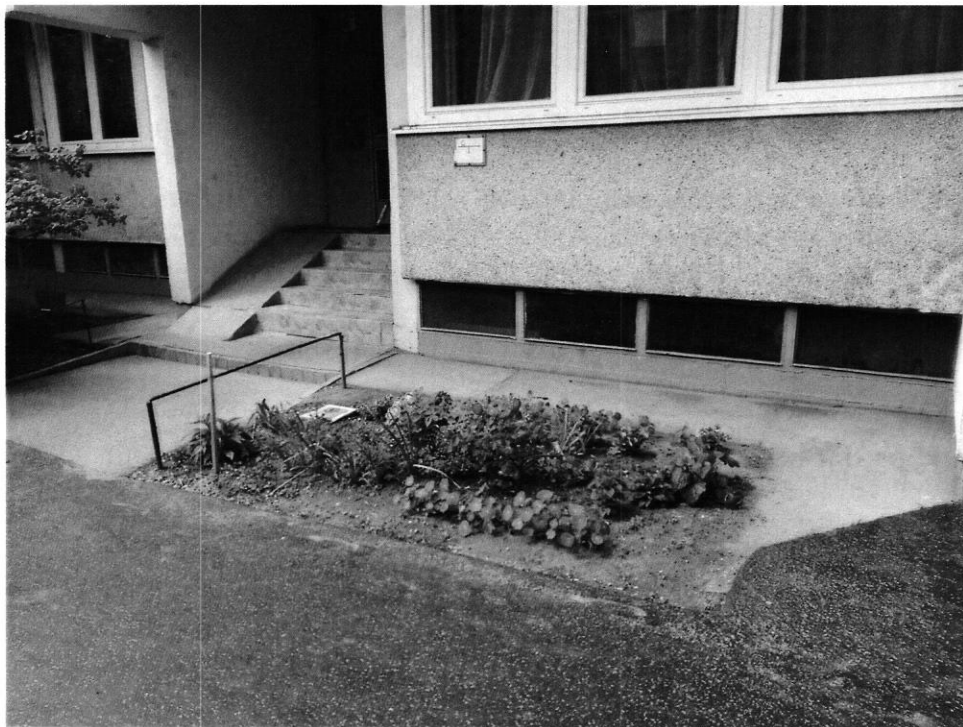
Jókai utca 11. (fsz. 2. előtti terület) 9,5 fm (téglalap alaprajzú terület)

2018. május 15. napjáig alábbi 2 igény érkezett a Polgármesteri Hivatal Környezetvédelmi Irodájához.