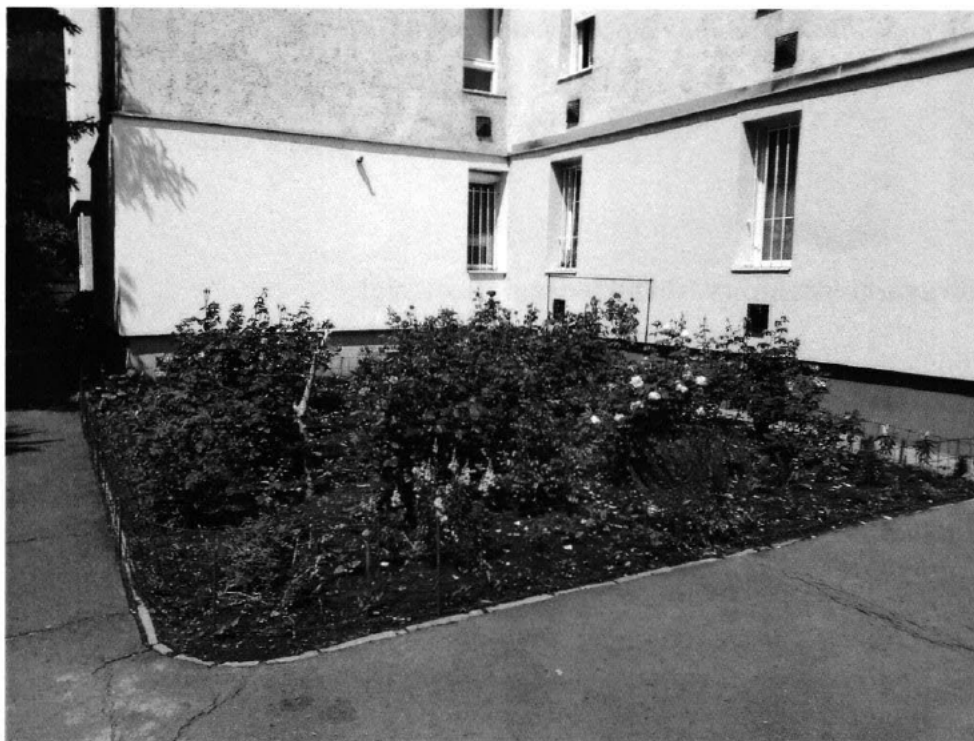
Sasvár utca 114. 29,5 fm (téglaalap alaprajzú terület)

Az összesen 39 fm vadászkerítés építésére a beszerzési eljárást a Bizottság döntését követően kezdi meg a Környezetvédelmi Iroda. A tavalyi árral számolva (bruttó 8.827 Ft/fm) 344.253 Ft az építés költsége. Ebből látható, hogy az 1.000.000 Ft fedezet elegendő az igényelt kerítés építésére.