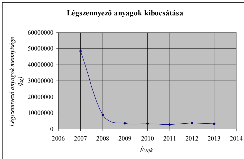
1. ábra: Légszennyező anyagok kibocsátása éves bontásban a kerületben

A legjelentősebb továbbra is a széndioxid kibocsátás mértéke. Ennek a légszennyező anyagnak az évenkénti alakulását a 2. sz. ábra tartalmazza. Az éves emisszió 2007-ben 48.384.848 kg, 2008-ban 8.643.196 kg, 2009-ben 3.452.564 kg, 2010-ben 3.327.256,65 kg, 2011-ben is tovább csökkent, 2.676.027,848 kg. A 2012-es évben a szén-dioxid kibocsátás is kisebb mértékű emelkedés tapasztalható, csak úgy, mint az összes légszennyező anyagoknál. A szén-dioxid kibocsátás éves mértéke 2012-ben 3.795.649 kg volt. 2013-ban itt újra csökkenés volt tapasztalható ezen a téren is, az éves kibocsátás 3.163.702 kg volt.