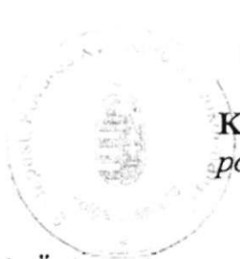
Kovács Péter polgármester

Budapest Főváros XVI. kerületi Önkormányzat és Budapest XVI. kerületi Polgármesteri Hivatal Közbeszerzési Szabályzatát a Képviselő-testület 324/2015. (XI. 18.) Kt. határozatával fogadta el.