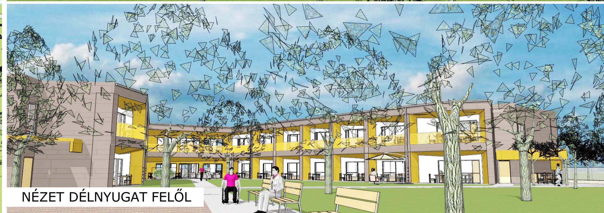
NÉZET DÉLNYUGAT FELŐL