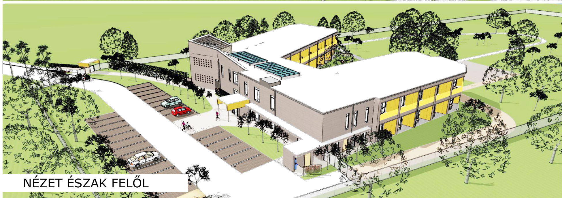
NÉZET ÉSZAK FELŐL