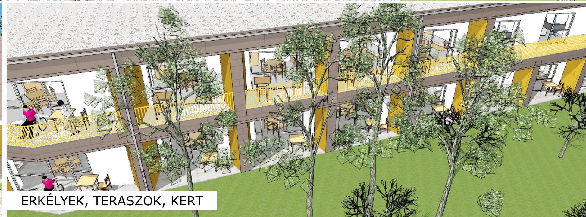
ERKÉLYEK, TERASZOK, KERT