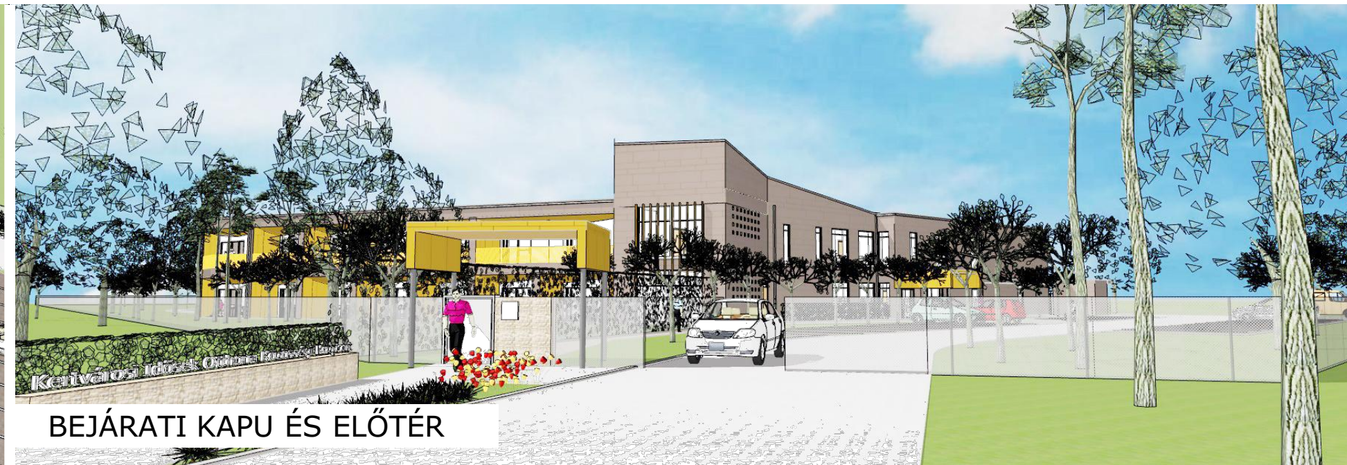
BEJÁRATI KAPU ÉS ELŐTÉR