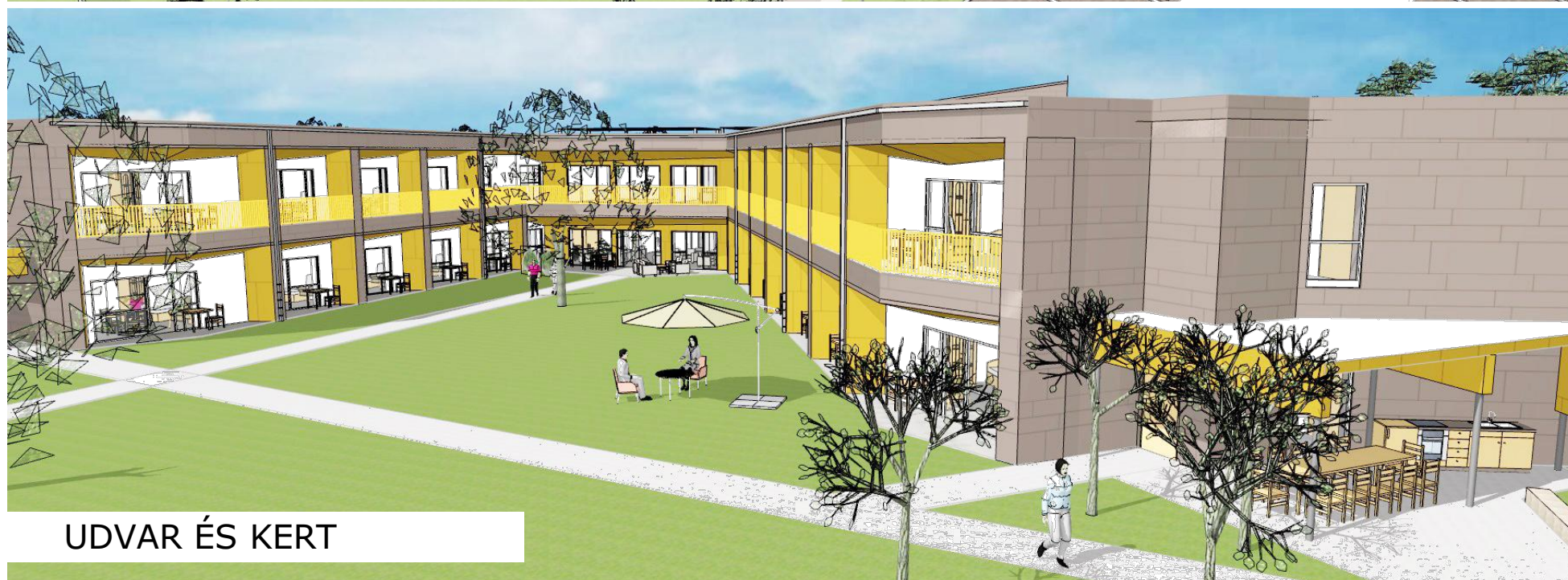
UDVAR ÉS KERT