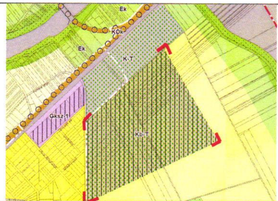
Cinkotai temető tartalékterület