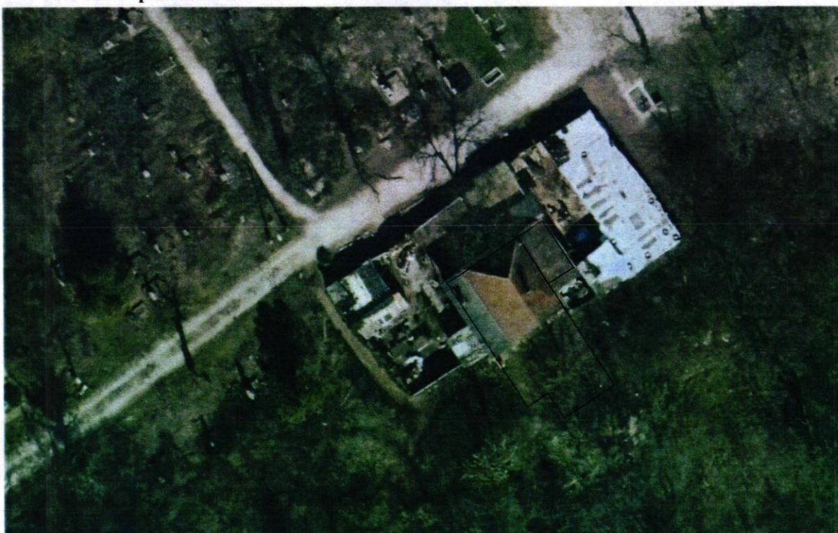
A ravatalozó épülete és a mellette található raktárak felülről.