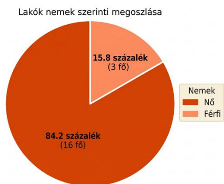
Ábra 1. Lakók nemek szerinti megoszlása

Az adatok alapján megállapítható, hogy a lakók átlagéletkora 85 év, a bentlakásos ellátást elsősorban a 80 év feletti korosztály veszi igénybe, amely jól tükrözi, hogy az ellátás elsősorban az idősebb, fokozottabb gondozási igénnyel rendelkező korosztály számára jelent megoldást.