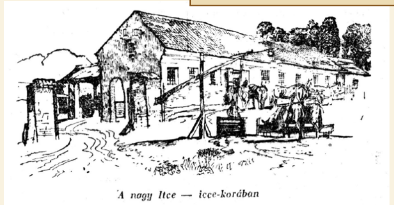
A nagy Itce — icce-korában

A CINKOTAI HATÁRÚT (MA BUDAPESTI ÚT) SASHALMI OLDALÁN ÉLT GRAFIKUSMŰVÉSZRŐL MÁR TÖBBSZÖR ÍRTUNK EBBEN A ROVATBAN. HOGY MÉGIS ÓRÓLA SZÓL EZ AZ ÍRÁS, TÖBB OKA IS VAN. EGYRÉSZT TERMÉSZETESEN Ő IS SZEREPEL A HELYTÖRTÉNETI FÜZETEK KÖVETKEZŐ (MÁRCIUS ELEJÉN MEGJELENŐ) KÖTETÉNEK KÉPZŐMŰVÉSZEKRŐL SZÓLÓ FEJEZETÉBEN, MÁSRÉSZT EGY HÓNAPJA ÉRDEKES CIKKET TALÁLTAM A MAGYARSÁG 1935. AUGUSZTUS 18-I SZÁMÁBAN, AMIBŐL KIDERÜL, NEM CSAK A RAJZ MESTERE VOLT, HANEM ÍRNI IS HANGULATOSAN TUDOTT. A CIKK ILLUSZTRÁCIÓI PEDIG EGY LASSAN ÉVSZÁZADOS VITÁT ZÁRNAK LE VÉGLEG. A CIKK A NEVEZETES CINKOTAI NAGYITCE FOGADÓRÓL SZÓL ANNAK OKÁN, HOGY A MEGJELENÉS IDEJÉN ÚJÍTOTTÁK FEL AZ EREDETI, RÉGI ÉPÜLETET.