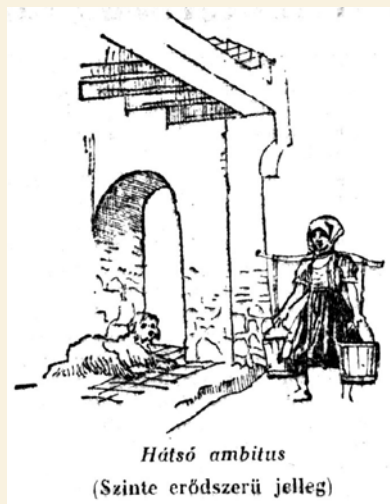
Hátsó ambitus (Szinte erődszerű jelleg)