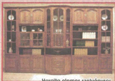
Hargita elemes szekréynsor