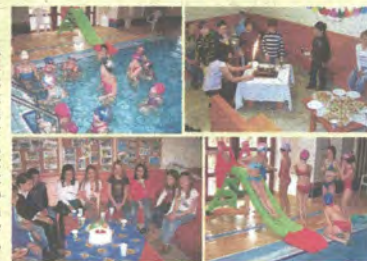
Születésnap bulik az uszodában

Három óra időtartamra vehetik igénybe az uszoda születésnap szolgálatát a gyerekek. Ebből az első két órában a tanmedence egyik felét bocsátjuk rendelkezésükre, a harmadik órában pedig terített asztal mellett lehet köszönteni, ajándékozni. Minden ünnepelt tizenöt főt hívhat meg a saját bulijára, így egyszerre legfeljebb tizenötven lehetnek a medencében természetesen szakember felügyelete mellett. Lehet üszni, csúszdázni, labdázni, vízi játékokat játszani, egyúttal mindent, ami a testi épségre nem veszélyes. A gyermek születésnapokat délutánra lehet kérni, általában 14-17 óráig. Zárás után azonban van lehetőség felnőtt rendezvényekre is . Mindkét uszoda várja cégek és magánberek jelentkezését a gyermekekéhez hasonló, de esti, felnőtt rendezvényekre. Lehet táncolni, bulizni, a legkülönbözőbb vízi és medenceparti vetélkedők is szóba jöhetnek, akárcsak az ilyenkor szokásos evés-ivás. Mindezekhez mindkét kerületi uszoda tudja biztosítani a feltételeket, és a biztonság kedvéért úszómesterről is gondoskodunk. A medencek partja emlékezetes helyszínre lehet mind családi évfordulók megünneplésének, mind céges rendezvényeknek.