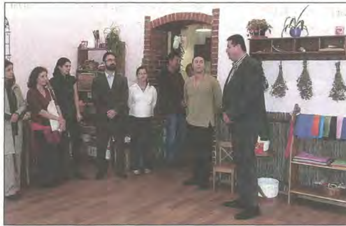
Többségben kerületi gyerekekkel töltik fel az intézményt

Szülői kezdeményezésre 1997-ben, egy kis XVII. kerületi családi házban alakult a Rákosmenti Waldorf Iskola. Majd a 2000-es évek elején áttette a székhelyét Sashalomra, a volt Corvin Művelődési Ház épületébe. Az óvoda azonban továbbra is a XVII. kerületben maradt. Egy darabig így, szétszakadva működött a régió egyetlen Waldorf-intézménye, majd a szülők úgy döntöttek, hogy az iskolához közelebb is létrehoznak egy óvodát. A Mátéháza utcában találtak is egy családi házat, amelyet önerőből óvodává alakítottak át. Ám mindnyájan tudták, ez csak ideiglenes megoldás lehet.