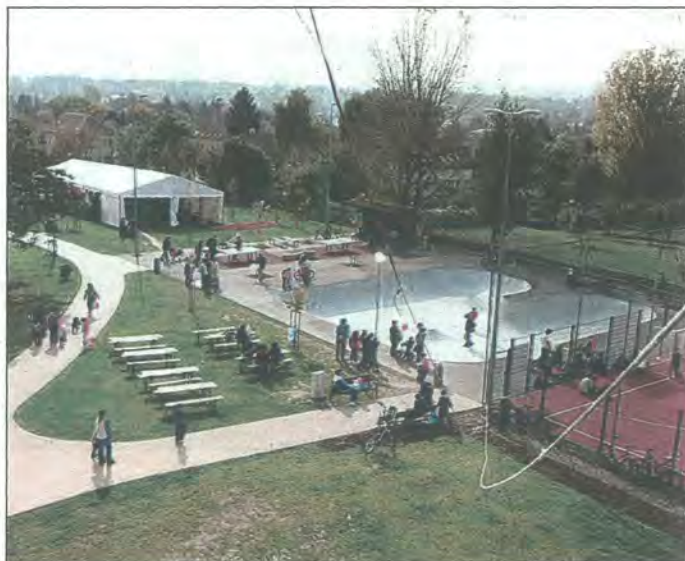
A Léptékterv Tájépítész Iroda munkatársai tervezték a megújult parkot

Miközben a polgármester beszédét tartotta, már egyre nagyobbra hízott az a hólégballon, amivel bárki ingyen felemelkedhetett a park fölé, hogy a magasból vegye szemügyre a friss zöld gyepet, a virágzó rózsaaágásokat és a park új elemeit. De nemcsak a hólégballon szórakoztatta