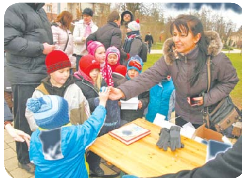
Tojásgyűjtő versenyt rendezett az ovisoknak a Kertvárosi Ifjúsági Önkormányzat március 23-án a Havashalom parkban.

A húsvétnak megfelelő, időben korábban kialakult ünnep a zsidó pészah (elkerülés, kikérvülés) volt, amely az egyiptomi fogságból való kiszabadulásnak állít emléket. Az Ótestamentum megfogalmazása szerint a halál angyala végigvonult a városon, de azokat a zsidó házakat elkerülte, amelyeknek ajtófélfáját megjelölték egy frissen leölt bárány vérével. A 325-ben megtartott első niceai zsinaton döntöttek úgy, hogy a keresztény húsvétot mindig ugyanazon a napon, vagyis a tavaszi napéjegyenlőség utáni első holdtöltét követő vasárnapon ünnepeljék. Ezután a katolikus egyház a XVI. század végén kánonban rögzítette a dátum kiszámításának módját. A két ünnep ritkán esik egybe.