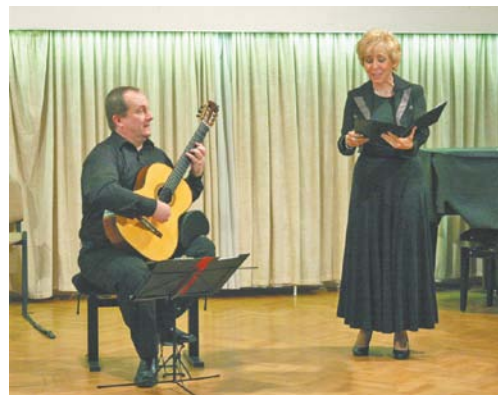
Kertesi Ingrid és Eötvös József

többi között a több évtizedes kulturális, tárgyi és építészeti értékek megővése mellett a művészek és a sportolók, de különösen a fiatalság támogatása.