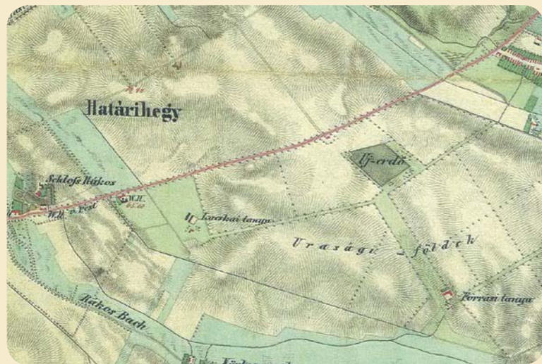
A Kerepes felé tartó úton az első a Rákospalotai fogadó (wh.), a második a Nagytize, fenn a jobb sarokban, Cinkota út menti szélén a községi kocsmára.

A vendéglő valós korai története körül nem kevesebb a titok. A kezdetek a homályba vesznek, sok a feltételezés, kevés a bizonyító irat, vagy tárgyi emlék. A XVI. kerület története című, 1970-ben kiadott műben, és a Corvin Hirnök 1988-as Cinkotát bemutató számában 1729-es pesti tanácsí jegyzőkönyvekre hivatkoznak, mint első hiteles híradásra a fogadóról. Ezzel az adattal azonban két probléma is van. Először is, a terület, ahol a fogadó állt, Cinkotához tartozott, a Beniczky vagyonfelbirtoka volt, tehát a pesti tanácsnak nem sok oka lehetett jegyzőkönyvet vezetni róla. Másodsor, az ismert 1.