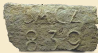
Tégla a ma is álló, a fogadóhoz tartozó épületből

Ezúton kérünk mindenkit, akinek története, szkenelhető képe van az 1950 előtti vendéglőkről, kocsmákról, kávéházakról, jelentkezzen a 06-30/484-5264-es mobiszámon, vagy a helytortenet16@gmail.com email címen. Az érdekes képekkel, történettel közreműködőknek - már az eddig összegyűlt képekkel is gazdagon illusztrált - elkészült művel köszönjük meg részvételüket a könyv szerkesztésében.