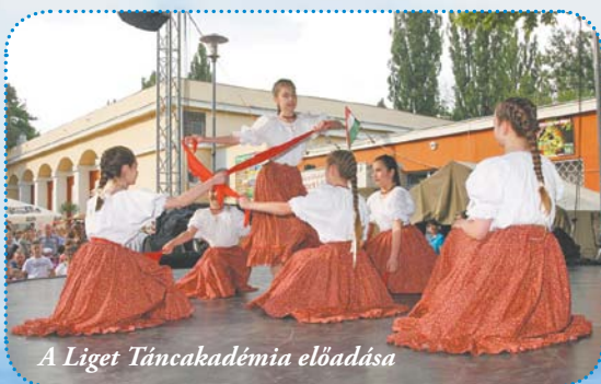
A Liget Táncakadémia előadása