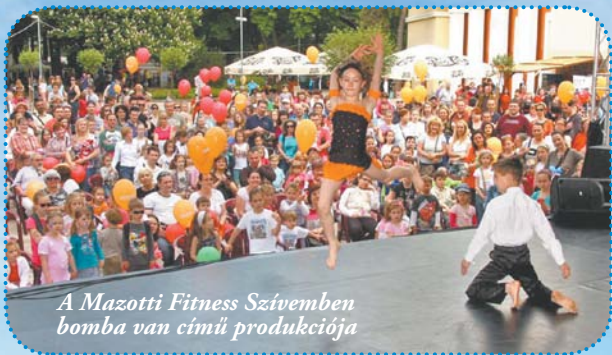
A Mazotti Fitness Szívemben bomba van című produkciója