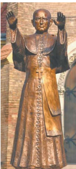
A rákosszentmihályi Mindszenty-szobor

– A Néri iskola munkálatait a cégem felügyelte teljesen ingyen. Emellett megalapítottuk a Wass Albert-bizottságot és az iskolában elhelyeztük az erdélyi író emléktábláját, az utcafronton pedig egy Néri Szent Fülöpöt ábrázoló bronz dombozművet. Rendbe hoztuk a rákosszentmihályi templom díszvilágítását és belső világítását is, illetve felépítettünk egy minden igényt kielégítő plébániát. Ezután elhatároztuk, hogy köztéri szoborral állítunk emléket Mindszenty József bíborosnak, amelynek érdekében létrehoztuk a Hittel a Nemzetért Alapítványt. Mint korábbi nagyszabású terveink esetében, ebben is támogató partnerként állt mellénk az Önkormányzat. Kovács Péter polgármester felajánlotta, hogy minden egyes alapítványi forint mellé a kerület odatesz még egyet. Ezzel gyakorlatilag megduplázódott a forrásunk, így a szobrot előbb felállíthattuk, mint reméltük. Ehhez nagy örömmel Isten segítségével én is jelentős összeggel tudtam hozzájárulni.