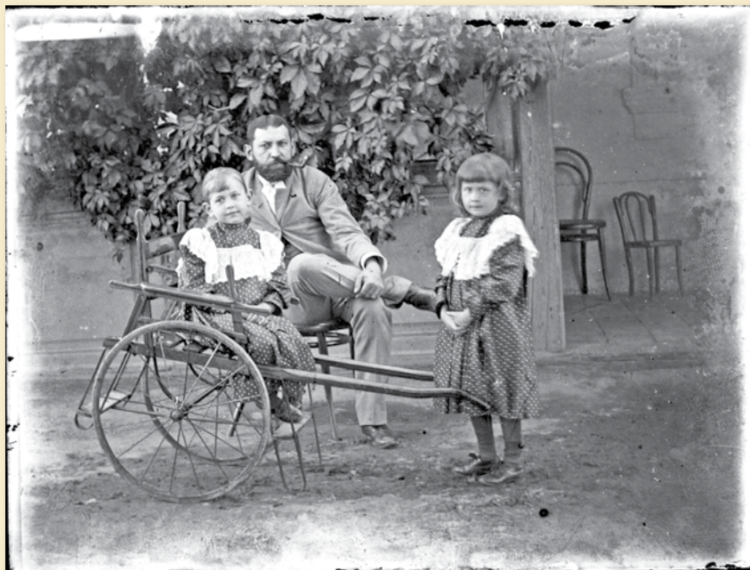
Mai digitális kópia Zettner Vilmos családi albumában megtalálható fénykép eredeti negatívjáról.

A kor, amiről az új kötet oldalainak képei adnak híradást, bő fél évszázadot ölel át, és a helyszín szintén a Budapest XVI. kerület elődtelepülései, Cinkota, Rákosszentmihály, Mátyásföld, Sashalom. Az időszak tehát nem sokkal a századforduló előtt kezdődik, utólag visszavetített aranykort mutat, megtörténik az első világháború, az ország szétszabdalása, válság, majd újabb háború következik. A „nagy” történelem nem mérte fukar kezekkel az eseményeket, ami nyilván kihatott a helyi történelemre is, de itt, ebben a könyvben erről legfeljebb csak közvetve lesz szó. Itt a hétköznapiak, a jelen pillanatai ragadtatnak ki. A polgárok fényképezkedni járnak, a