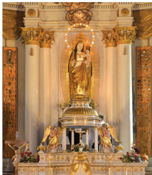
A székekelyek "babba"-nak, vagyis szépnek nevezik a Boldogasszonyt.