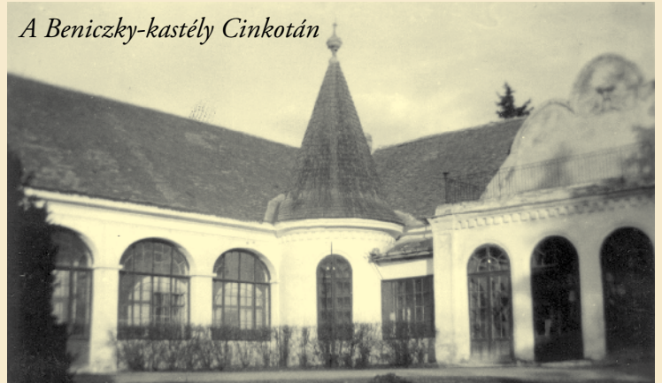
A Beniczky-kastély Cinkotán

tak a tehenistállók és a szükséges melléképületek is. A munkát béresek végezték, akik többségükben a mai József és Madách utcákban laktak, az 1870-es évek közepétől felépített, részben még ma is álló vályogházacskákból. A jelentős méretű tehenészet a II. világháború idejére tönkrement és a gazdaság épületeit fokozatosan lebontották.