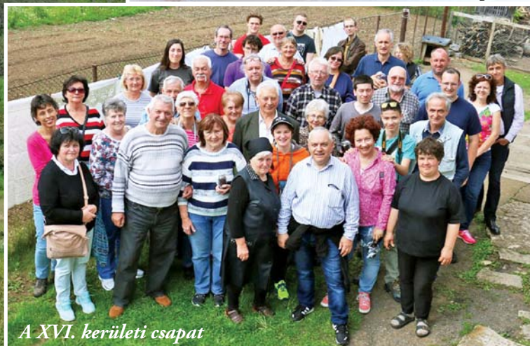
A XVI. kerületi csapat