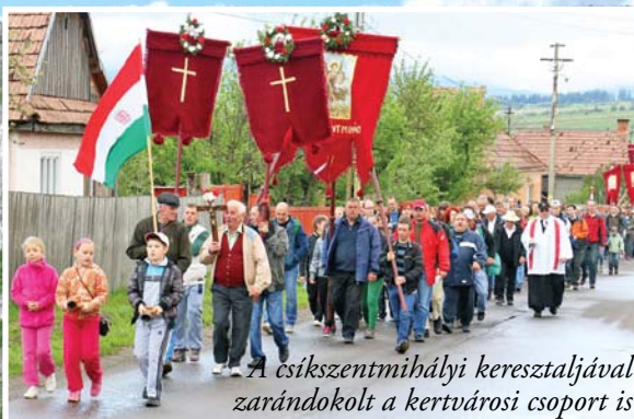
A csíkszentmihályi keresztaljával zarándokolt a kertvárosi csoport is