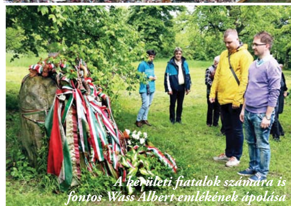
A kerületi fiatalok számára is fontos Wass Albert-emlékének ápolása