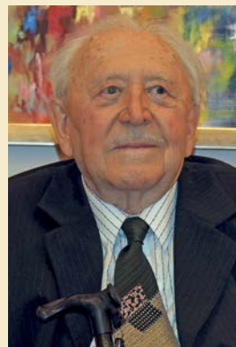
Akkor és most

nyeihez, a mi kutatómunkánkat is megkönnyítette.